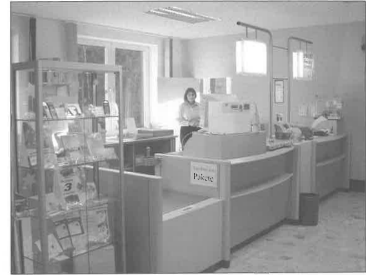
Mit der Neuausstattung des Postamtes Leutasch sind auch alle Schließungsgerichte vom Tisch