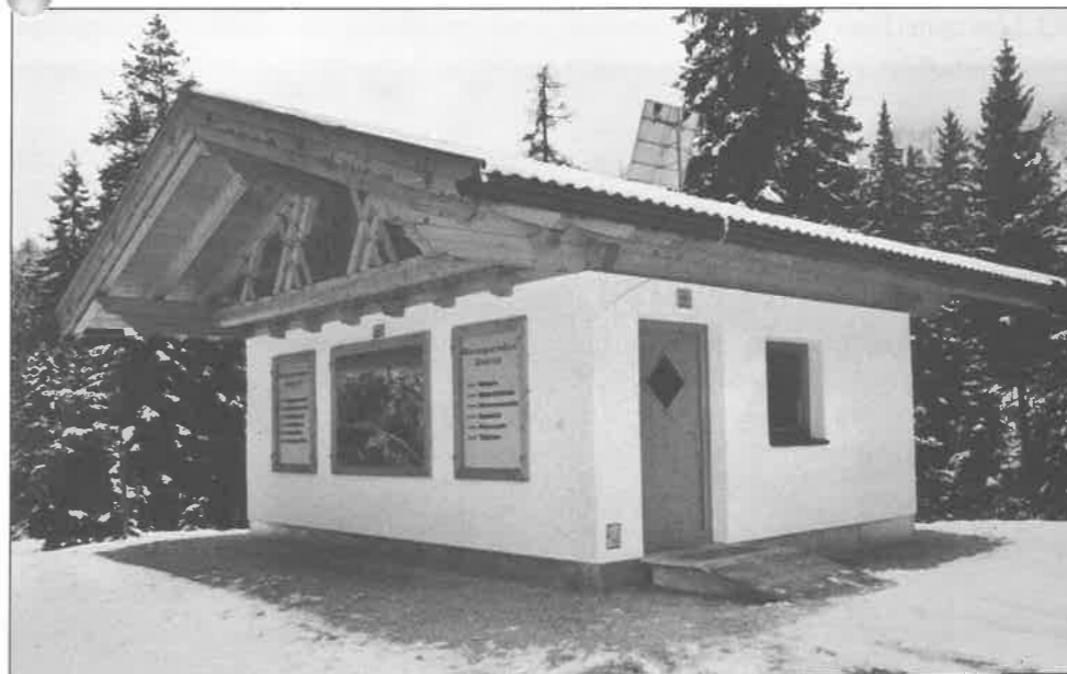
Dieses schicke Häuschen am Parkplatz Salzbach birgt eine WC-Anlage und Informationstafeln für Wanderer. Es ist völlig unabhängig von jeglicher Energieversorgung - die Stromversorgung erfolgt über Solar-Energie

sammen nicht darüber hinweg kommen, gemeinsam diese Umweltmaßnahmen zu finanzieren. Wenn wir weiterhin unter dem Slogan »Natürlich Leutasch« um Gäste werben, so ist Grundvoraussetzung, dass wir unsere Umwelt in Ordnung halten und in der weiteren Folge saubere Gewässer den Erholungssuchenden anbieten können.