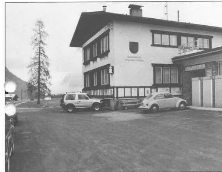
Frisch gestrichenes Gemeindehaus - neu asphaltierter Vorplatz - das Gemeindezentrum kann sich wieder »sehen lassen«

Anschlagtafeln wurden freundlicher gestaltet. Das Postamt hat ebenfalls ein neues Outfit erhalten - die Geschäftsausstattung wurde erneuert und mit modernen EDV-Geräten ausgestattet. So sieht das über 30 Jahre alte Gebäude wieder sehr ansehnlich aus. Nach der Sanierung der WC-Anlagen in der Leichenhalle ist so ein weiterer Schritt zur Verschönerung des Kirchplatzes gelungen.