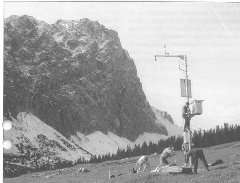
Das ist die Schneemess-Station am Puit-Egg. Die ermittelten Daten werden automatisch über Funk in das Gemeindeamt übertragen